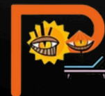
PLAGE DE PASSABLE ST JEAN CAP FERRAT